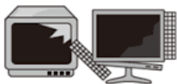
ブラウン管・液晶・プラズマテレビ