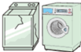
洗濯機・衣類乾燥機