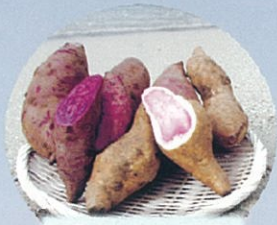
サツマイモ (紅イモ等)