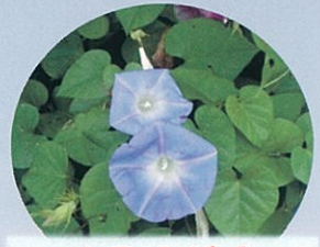
アサガオ (宿根アサガオ等)