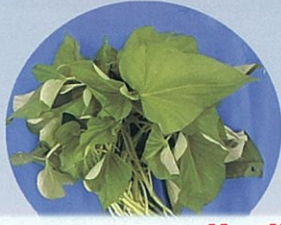
サツマイモの茎・葉 (カンダバー)