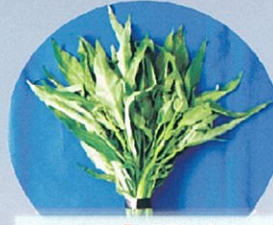
ヨウサイ (ウンチェーバー)