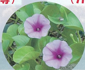
ガンバイヒルガオ